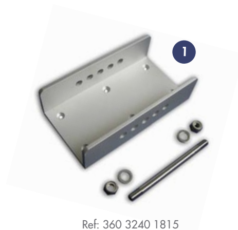
Ref: 360 3240 1815