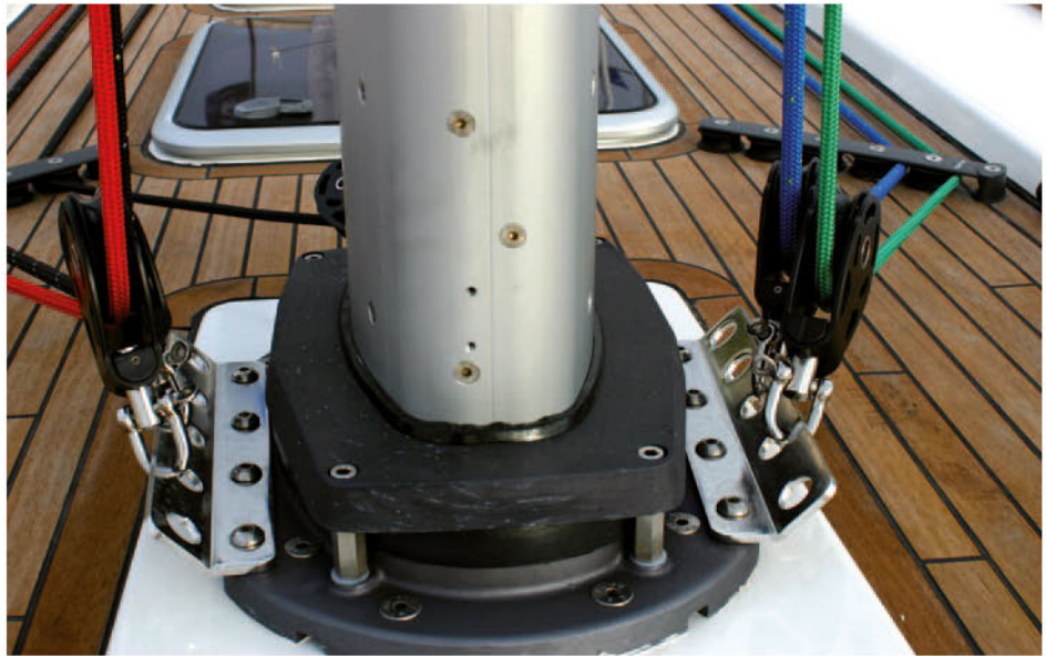
Deck collar including wedging and deck waterproofing, as well as the halyard blocks for keel stepped masts.