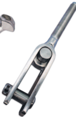
Toggle fork with thread term Chape articulée + embout fileté