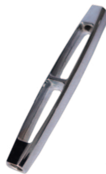
Open body Cage ridoir