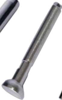
Ball term Embout à boule