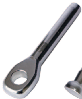
Eye terminal Embout œil