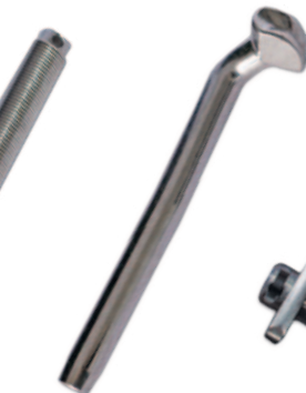
T term Embout en T