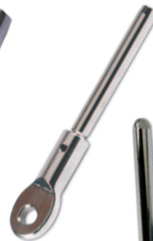
Rod eye Embout œil Rod