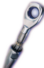
Compression stud Embout manuel